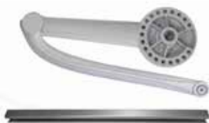
À glissière - Version gauche Pour portes jusqu'à 1,8 m