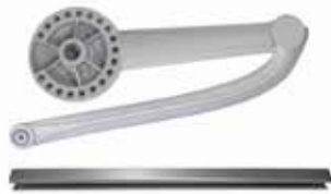
À glissière - Version droite Pour portes jusqu'à 1,8 m