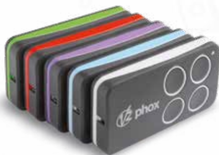
Émetteur radio Phox