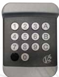
Clavier à code Kibo