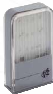
Feu à led Lumos