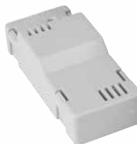
Chargeur de batterie