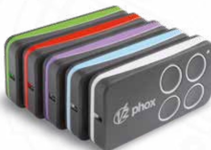
Émetteur radio Phox