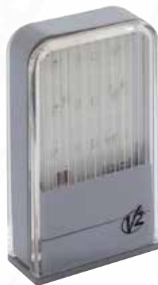
Feu à led Lumos