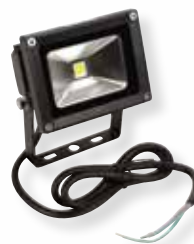
Projecteur à LED