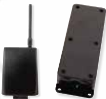
Contrôle radio des barres palpeuses