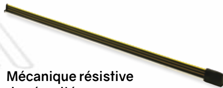
Mécanique résistive de sécurité