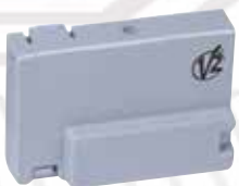
Récepteur embrochable MR2