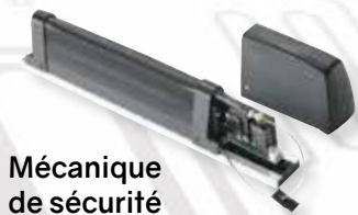
Mécanique de sécurité