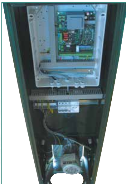
CTC REVERS 3i