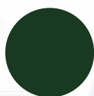
MG6005 VERT MOUSSE