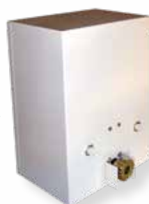
CAISSON REVERS 3I

Ces motoréducteurs sont également disponibles dans des coffrets individuels