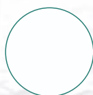
MG9010 BLANC PUR