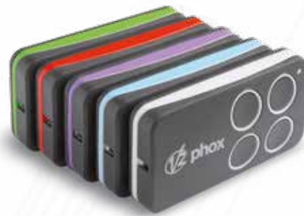
Émetteur radio Phox