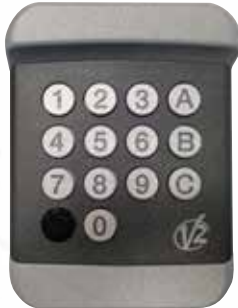
Clavier à code Kibo