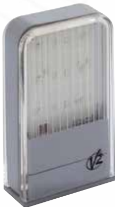
Feu à led Lumos