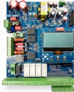
START-ONE Jusqu'à 2 moteurs 230 Vac Horloge interne paramétrable