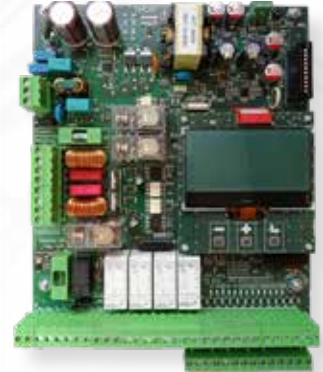
STARTECO PLUS Jusqu'à 2 moteurs 230 Vac Horloge interne paramétrable Port USB pour MàJ Firmware