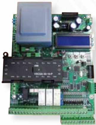
STARTECO 4 Horloge interne paramétrable