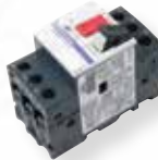
Protections magneto-thermique disponible en 1 - 1,6 A ou 1,6 - 2,5 A ou 2,5 - 4 A OU 4 - 6,3 A