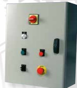
Coffret MODULIS 3 Coffret 500 X 400 mm