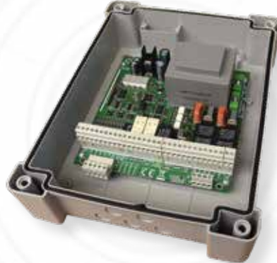
START RM Jusqu'à 2 moteurs 230 Vac Adaptable en lieu et place d'une platine 1332