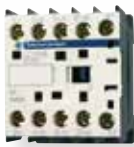
Contacteur tripolaire simple 24 V ou 220 V