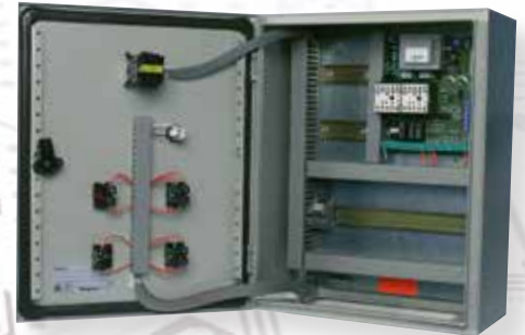
Coffret STARTECO 4 Coffret 500 X 400 mm