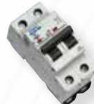
Disjoncteur 6A ou 10A