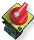
Poignée sectionneur cadenassable tripolaire ou tétrapolaire