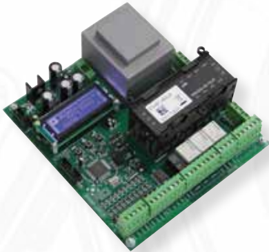
START INDUS Pour moteur 230 ou 400 V, monophasé, avec ou sans fin de course ou triphasé