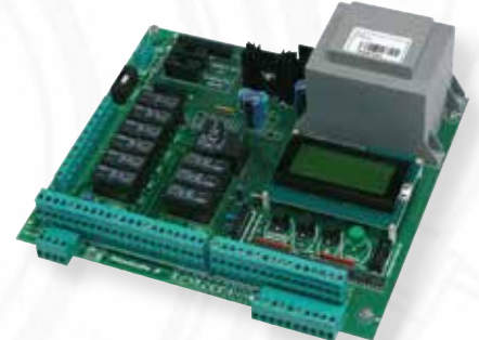
MODULIS 3 Commande digitale programmable