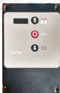
D-PRO AUTOMATIC Simple à programmer et diagnostic immédiat grâce à l'afficheur 4 chiffres intégré dans le couvercle