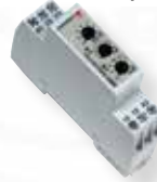
Tempo multifonction DMB51CM24