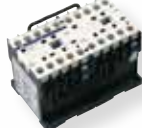
Contacteur inverseur pour 4 kW 400 V 24 Vac