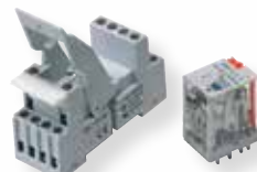
Relais industriel 4 RT/5 A disponible en 12 Vac, 2 Vcc, 24 Vac, 24 Vcc, 230 Vac, 48 Vcc sans socle