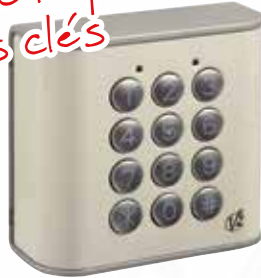
Clavier à code Sirmo-Digit