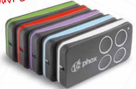
Émetteur radio Phox