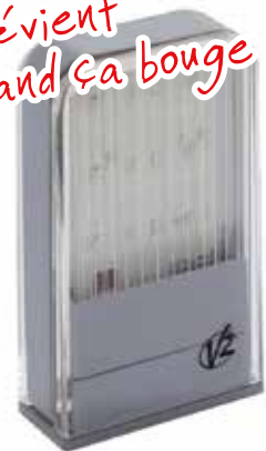
Feu à led Lumos