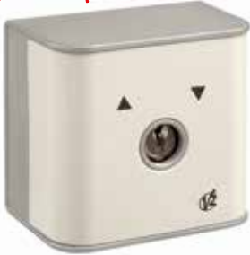
Sélecteur à clé Sirmo